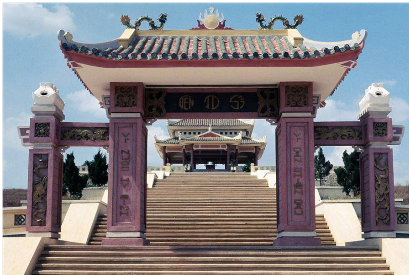
Đền Từ Sĩ 1975

Qua Cổng Tam Quan, con đường dẫn đến ngôi Đền Từ Sĩ trên một ngọn đồi nhỏ có 4 lối lên bốn phía. Đây là nơi để linh cữu các vị tướng lãnh trước khi chôn cất. Đây cũng là nơi khi tổng thống, thủ tướng hay các giới chức cao cấp chủ tọa các buổi lễ chiêu hồn từ sĩ.