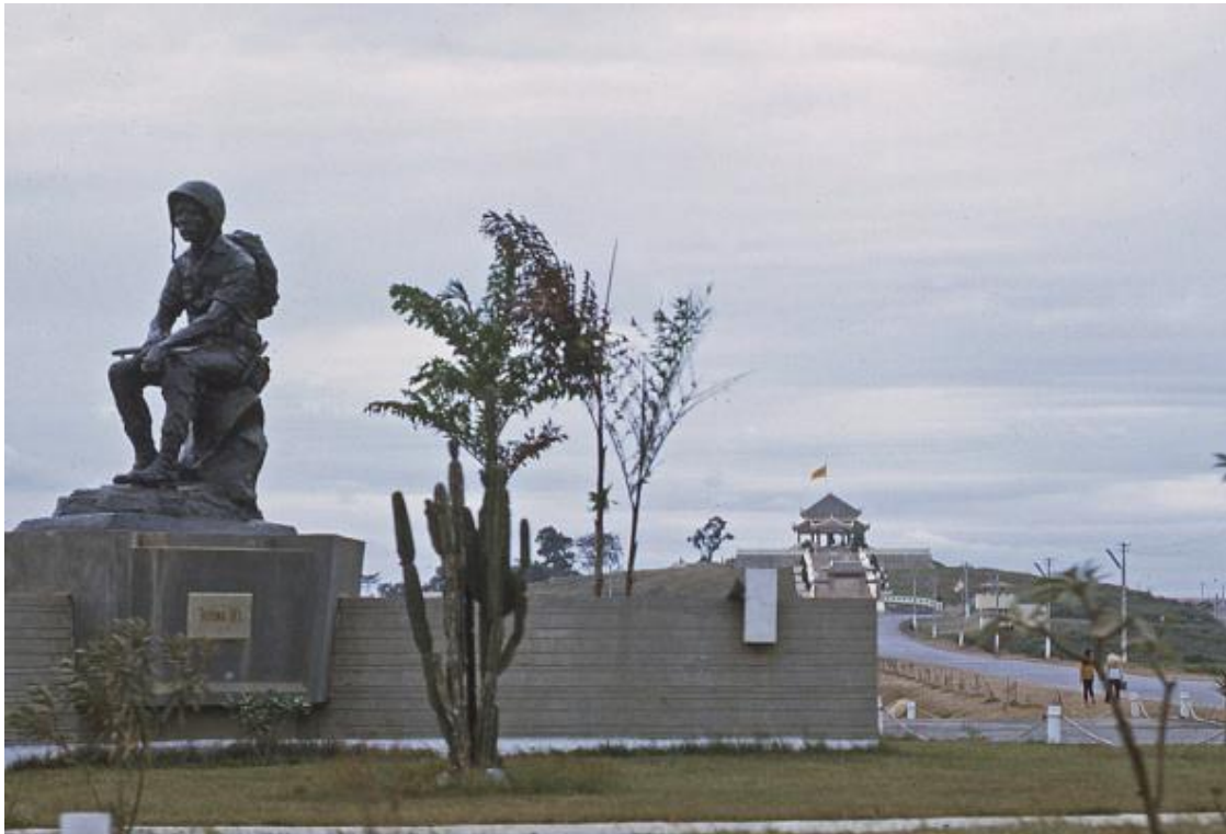
Hình bức tượng Thương Tiếc trước năm 1975

Ngoài bức tượng kể trên, trên đường vào nghĩa trang, đi theo con đường chánh xuyên tâm, lên dốc cao, phải qua Cổng Tam Quan, một công trình xây cất giản dị nhưng bề thế và chân phương. Giữa cảnh hoang tàn rêu phong hiện nay, Cổng Tam Quan vẫn giữ được đường nét vững vàng và gần như còn nguyên vẹn.