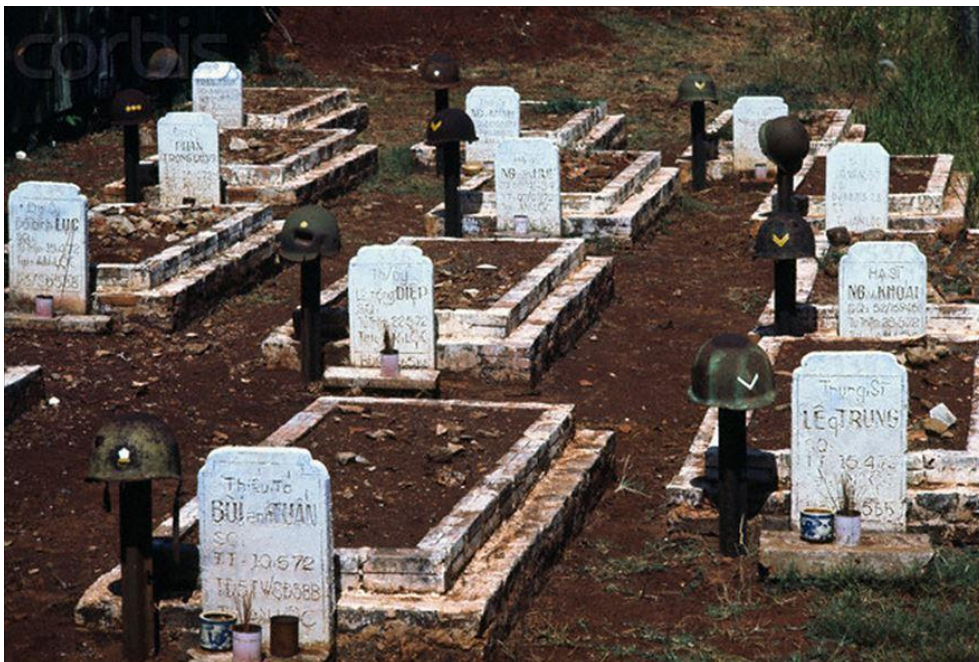
Dự Án Nghĩa Trang Quân Đội Biên Hòa Mộ phần Tử Sĩ 1975

Giữa lưng con ong là Nghĩa Dũng Đài cao 43 thước. Đầu ong là đền thờ chiến sĩ, cũng có lúc gọi là Đền Tử Sĩ hay Đền Liệt Sĩ. Phía dưới chân đền là Công Tam Quan nổi thẳng một đường dài ra xa lộ. Con đường này làm thành cây kim nhọn của con ong và đầu kim là bức tượng Thương Tiếc ngay cạnh xa lộ.