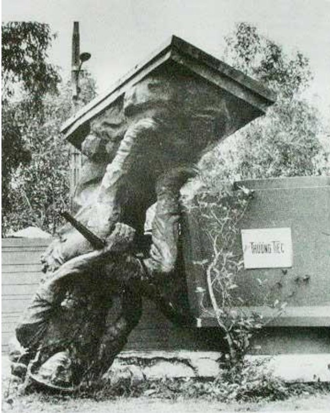
Tượng Thương Tiết sau 1975

Tổng thống Nguyễn Văn Thiệu và phu nhân viếng thăm nghĩa trang Quân Đội Biên Hòa